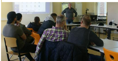
Abbildung 3 Internetkriminalität