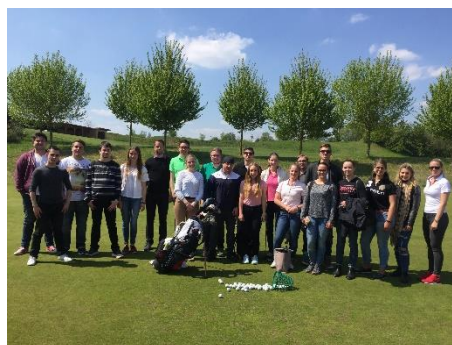
Abbildung 4 Golf Schnupperkurs