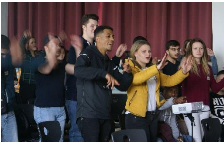
Abbildung 10 Gospelprojekt