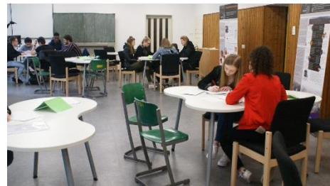
Abbildung 8 Die Klasse FOS 11 A in der Ausstellung "Auf und Davon"