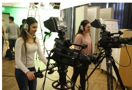
Abbildung 2 Fotoprojekt Eurovision(en)