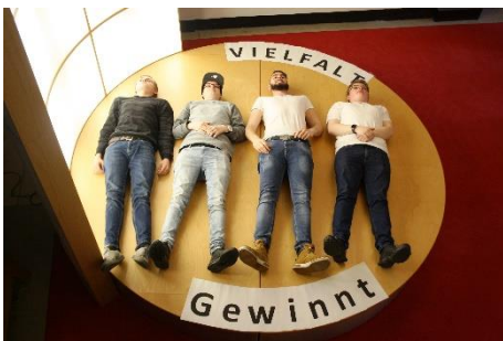
Abbildung 9 Fotoprojekt Eurovision(en)