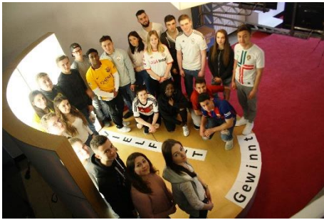
Abbildung 6 Fotoprojekt Eurovision(en)