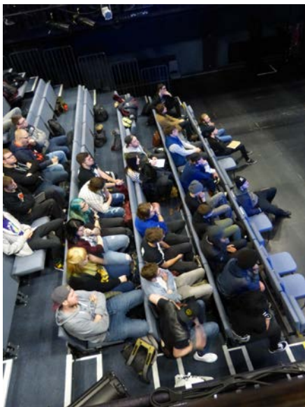
A first lecture on light in the CAST, Doncaster