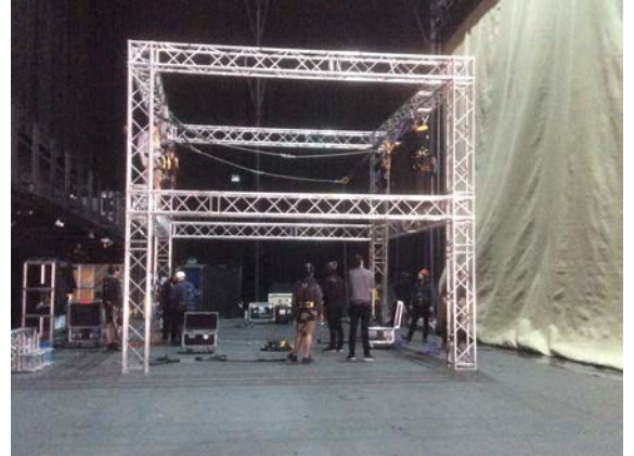
With zero mountains around you build your own structure - if you fancy climbing