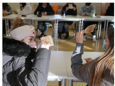
Schülerinnen u. Schüler der Klasse 11EH7 bei der Sicherheitsprüfung